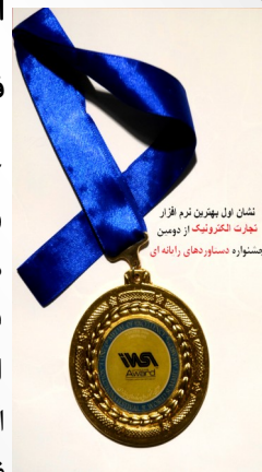
نشان اول بهترین نرم افزار تجارت الکترونیک از دومین جشنواره دساوردهای راهانه ای

چندی قبل نصب و راه اندازی نرم افزار فروش فروشگاههای کیان در فروشگاه Qmart واقع در کشور امارات و فروشگاه شیرین غسل واقع در کشور کردستان عراق با موفقیت به اتمام رسید. شایان ذکر است که کلیه زیرسیستم ها اعم از مدیریت فروشگاه، مدیریت کالا و انبار، سیستم فروش، حسابداری و ... به زبان انگلیسی راه اندازی و کلیه امور مربوط به تبدیل ارزها با انواع روش های پرداخت عملیاتی گردیده است. شرکت کیان با این حرکت مسیری جدید در صادرات نرم افزارهای فروشگاههای آغاز و اخبار این موفقیتها در آینده منتشر می شود.